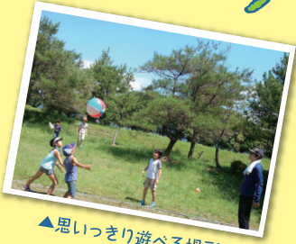
▲思いっきり遊べる場所！