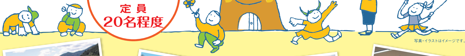
写真・イラストはイメージです。

3.11 東日本大震災以降、様々な環境の変化により、移住を検討されているご家族を対象とした子育て移住体験ツアーを高知県香美市で開催します。移住相談、空き家見学、小学校や保育園の見学、IUTターン者や地元の方との交流等の内容を予定しています。自然に囲まれた香美市で新しい暮らしを探しに来ませんか？