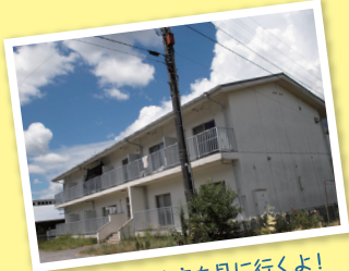
▲お試し住宅も見に行くよ！