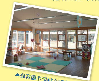
▲保育園や学校も紹介！