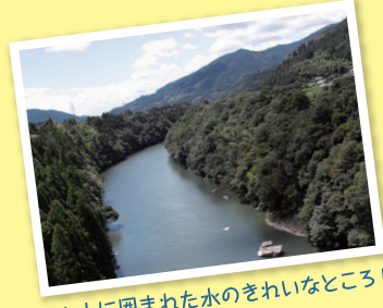
▲山に囲まれた水のきれいなところ！